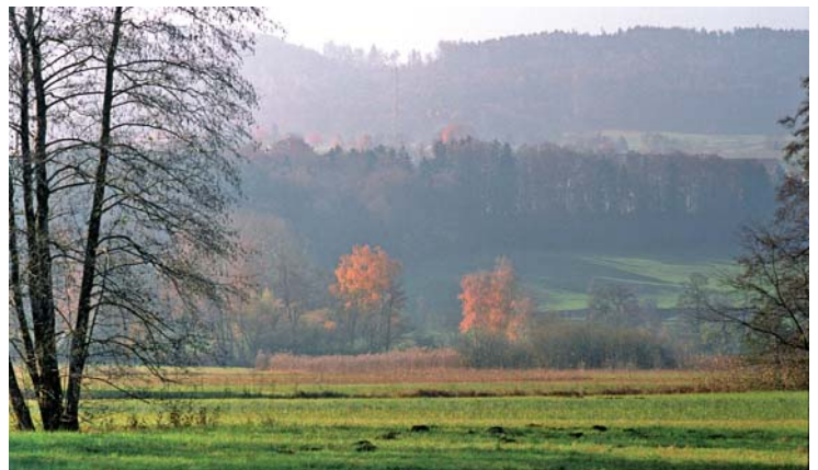
Herbst in den Seewisen