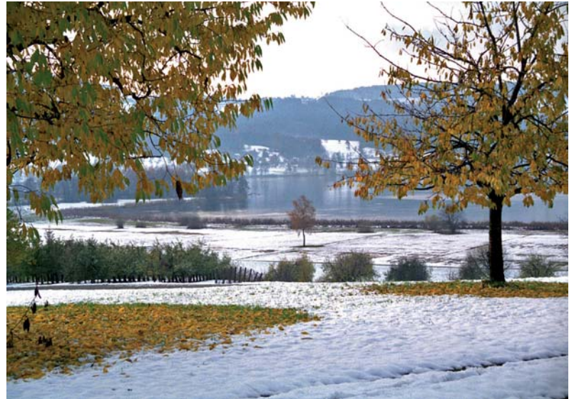
Blick vom Bergli Riedikon auf den Greifensee

Folgen Sie ab dem Hauptwegweiser (♥ 1) (gegenüber dem Mönchhof an der Usterstrasse) dem Wanderweg in Richtung Uster. Über den Widenbüel und das ehemalige Widenriet gelangen Sie zur Breitacherstrasse (♥ 2). Folgen Sie dieser durch den Weiler Breitacher und in den Wald hinein.