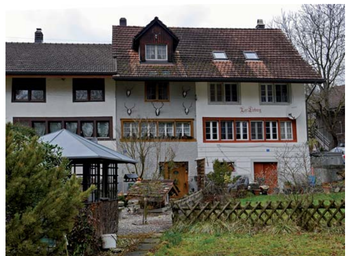
Flarz im Weiler Lieburg