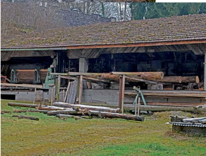
Sägerei im Weiler Lieburg